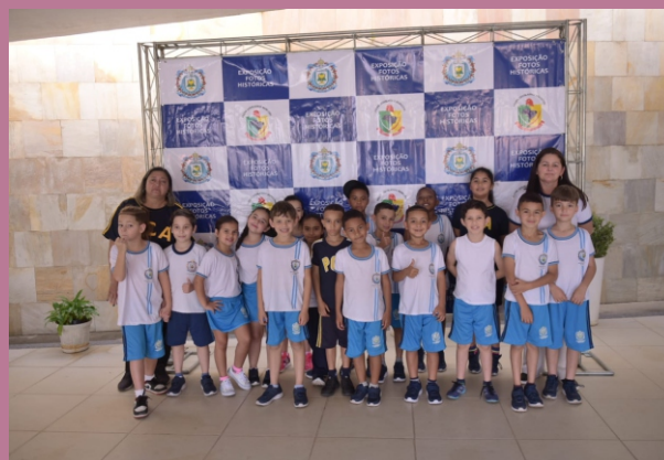
Turma da Escola Municipal Padre Correia de Almeida

Agradecemos todos aqueles que estiveram prestigiando e participando desse momento tão especial.