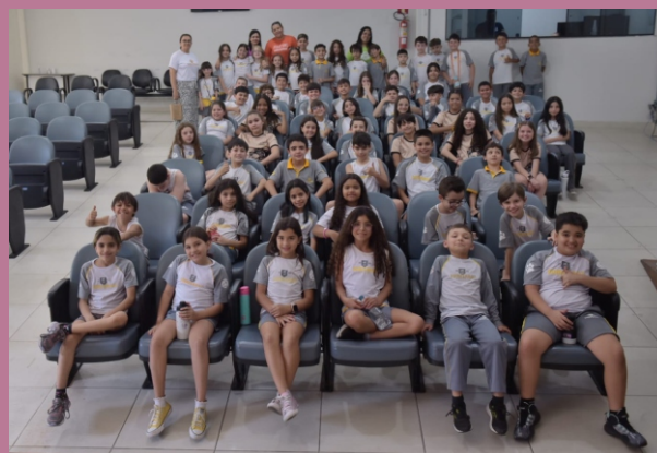
Turma do Colégio Dom Ferraz