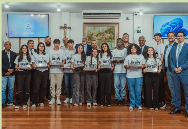
Vereadores municipais e vereadores do Parlamento Jovem