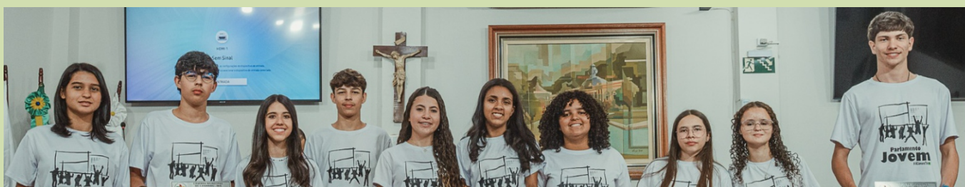
Vereadores do Parlamento Jovem - Legislatura 2025