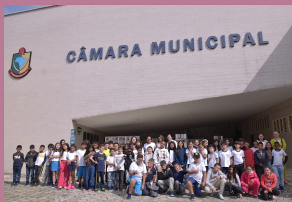
Turma da Escola Municipal Padre Correia de Almeida