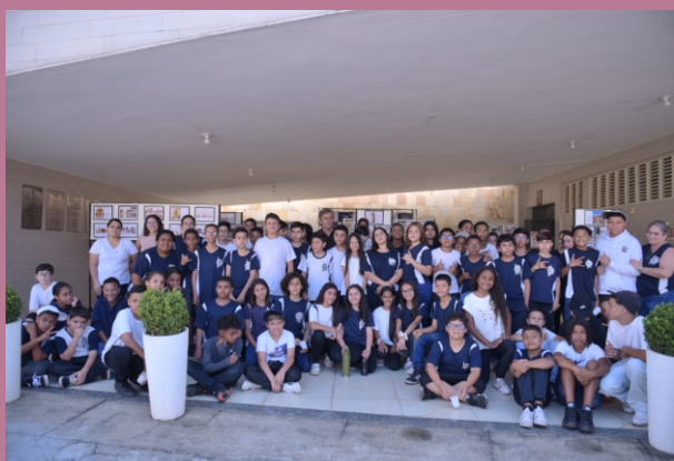
Turma da Escola Estadual Ruth Martins de Almeida – EERMA