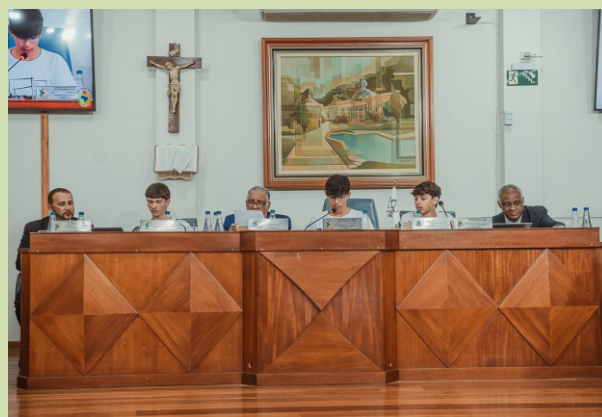
Mesa diretora com os Vereadores do Parlamento Jovem