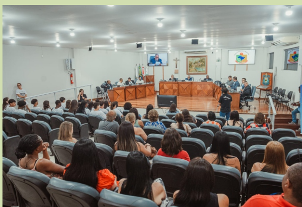
Público presente na posse

O Parlamento Jovem é um espaço de aprendizado e participação que contribui para o desenvolvimento da consciência política dos adolescentes, preparando-os para atuar de forma ativa e responsável na comunidade.