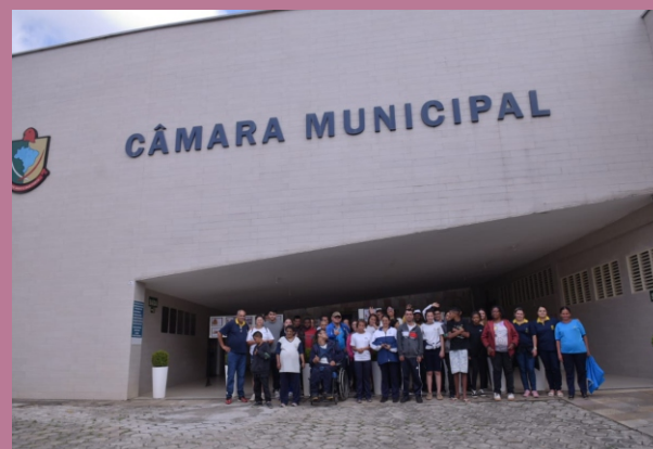
Turma da APAE