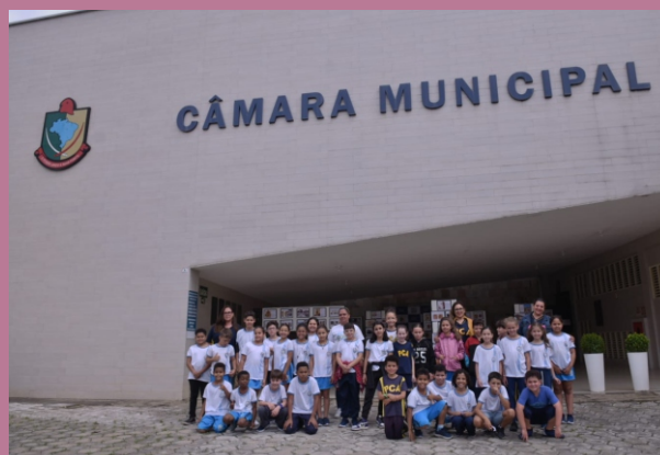
Turma da Escola Municipal Padre Correia de Almeida