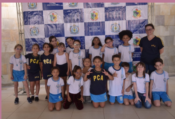
Turma da Escola Municipal Padre Correia de Almeida